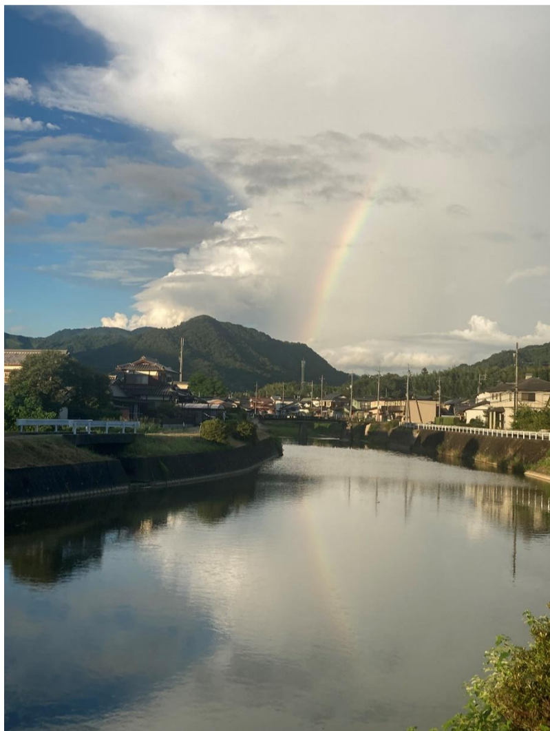
題名 狐の嫁入り 出展者 渡辺紀子 場所 ほたる橋近く