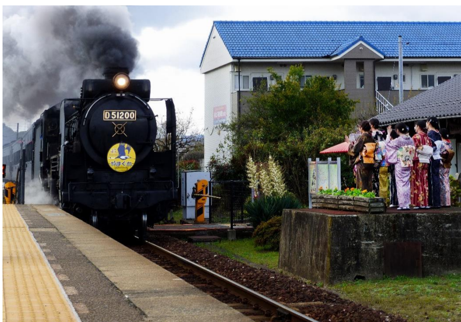
題名 SLと和服乙女 出展者 来栖旬男 場所 JR 宮野駅