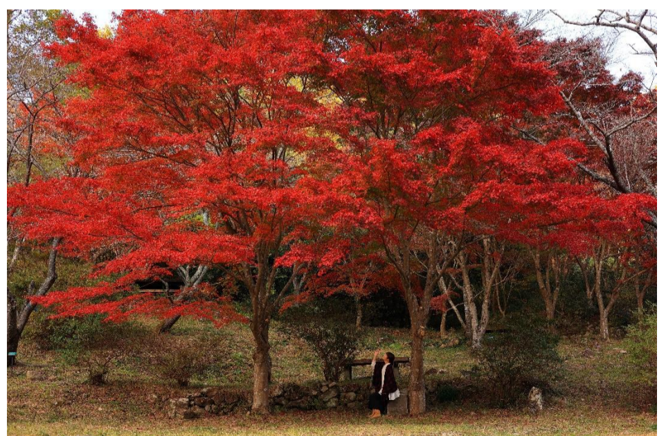
題名 大きな紅葉の木の下で 出展者 藤井正文 場所 宮野上 木戸山公園