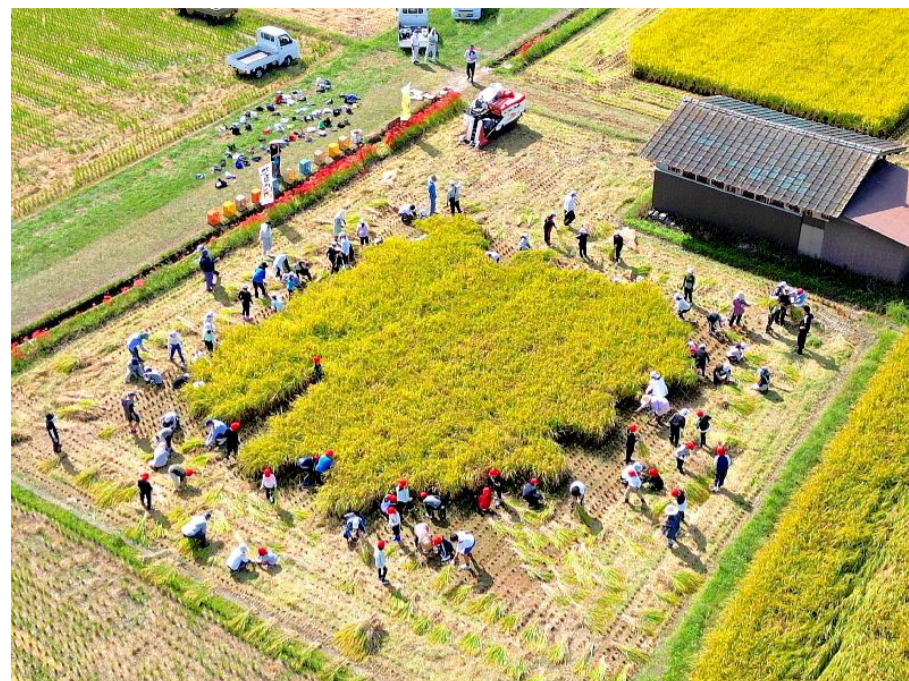
題 名 体験学習の日 出展者 杉山 秀男 場 所 上 恋 路