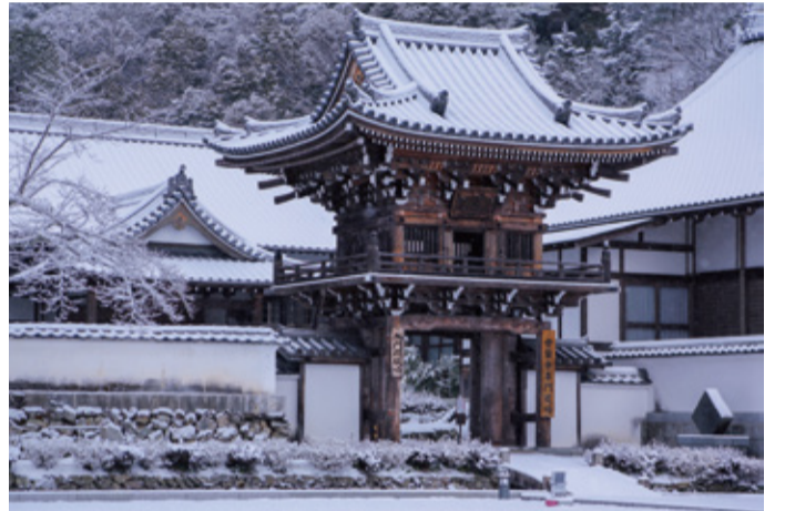
入選「雪の鍾桜門」 撮影場所：常栄寺

10 日 月 火 水 木 金 土 1 2 3 4 5 6 7 8 9 10 11 12 13 14 15 16 17 18 19 20 21 22 23 24 25 26 27 28 29 30 31