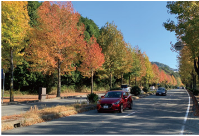
優秀賞「紅葉ライン ルート262」 撮影場所：宮野下恋路