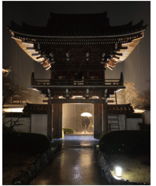
優秀賞「冷雨の候」 撮影場所：雪舟庭