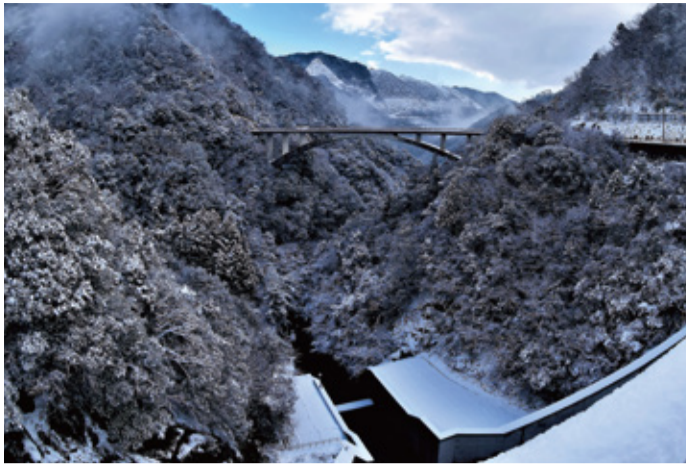
優秀賞・特別賞「冬ざれの荒谷」 撮影場所：宮野上 荒谷ダム