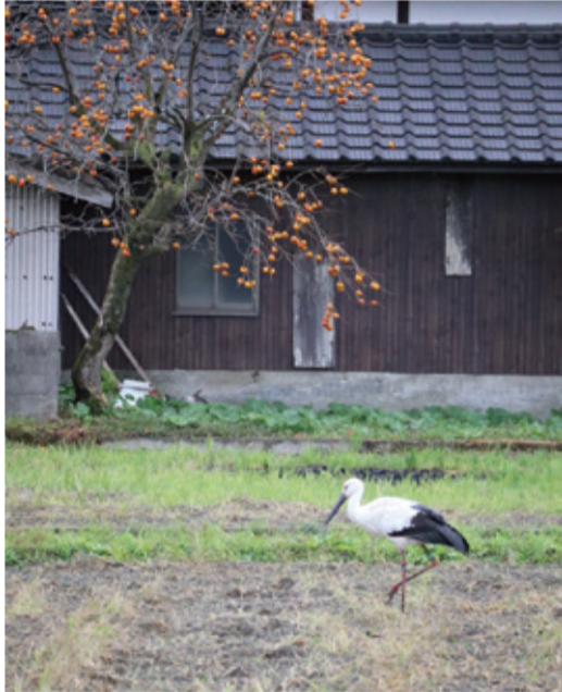
入選「コウノトリがやって来た！」 撮影場所：上恋路