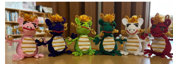
この置物は、「干支の置物教室」で作った辰の置物です。